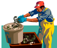
Trabajando en la pesca

Algún otro trabajo similar, por favor explique: