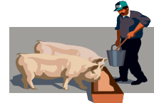
Trabajando con animales como cabras, ovejas, caballos, Conejos o cerdos.