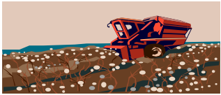
Piscando algodón, verduras, nueces, soja, heno, caña de azúcar.

SÍ (Por favor marque todos los que aplican y continúe a pregunta 2)