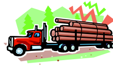
Trabajando en la madera