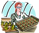
Trabajando en un invernadero plantando plantas