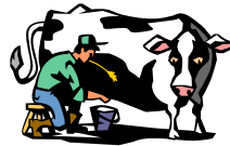
Trabajando en una lechería